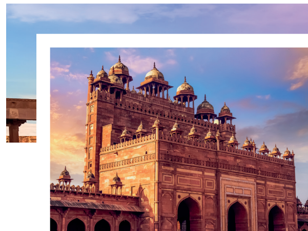
Fatehpur Sikri, Agra, India

palazzi dagli interni sfarzosi, gode di una magnifica vista sulla città. Visita al cenotafio di Jaswant Thada. Proseguimento per Jaipur, vivace "città rosa" capitale del Rajasthan. Visita al colorato bazar.