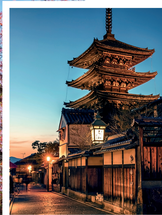
Yasaka Pagoda, Kyoto, Giappone