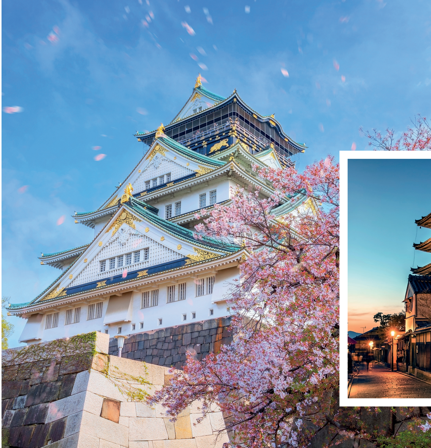
Castello di Osaka, Osaka, Giappone

Trasferimento all'aeroporto di Osaka Kansai.