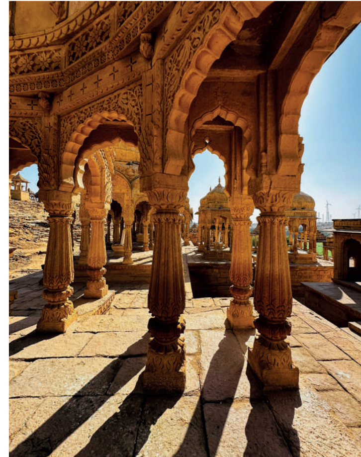
Bada bagh chhatri, Jaisalmer, India

Proseguimento per Jaipur, la vivace "città rosa" capitale del Rajasthan. Visita al colorato bazar.