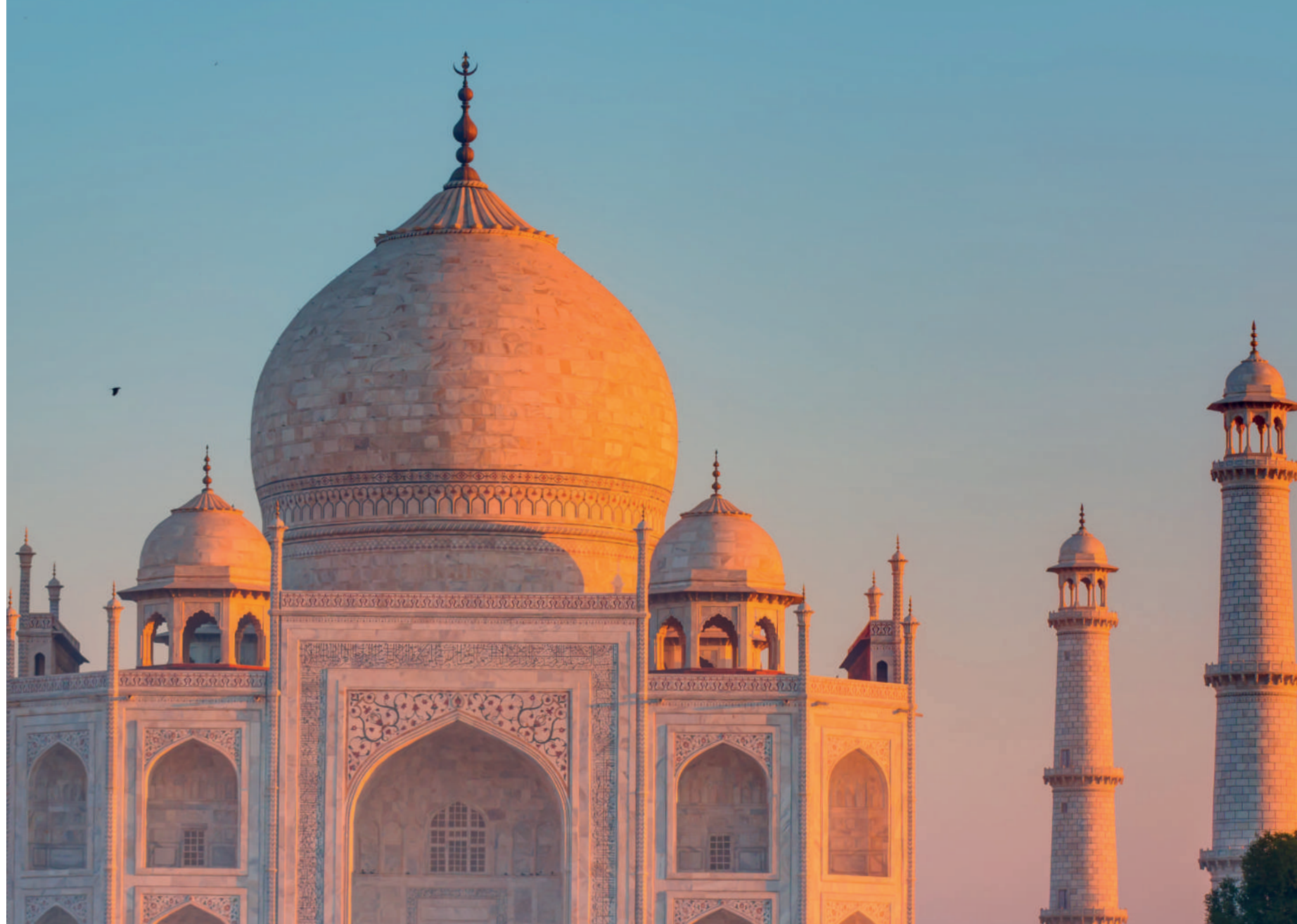
Taj Mahal, Agra, India