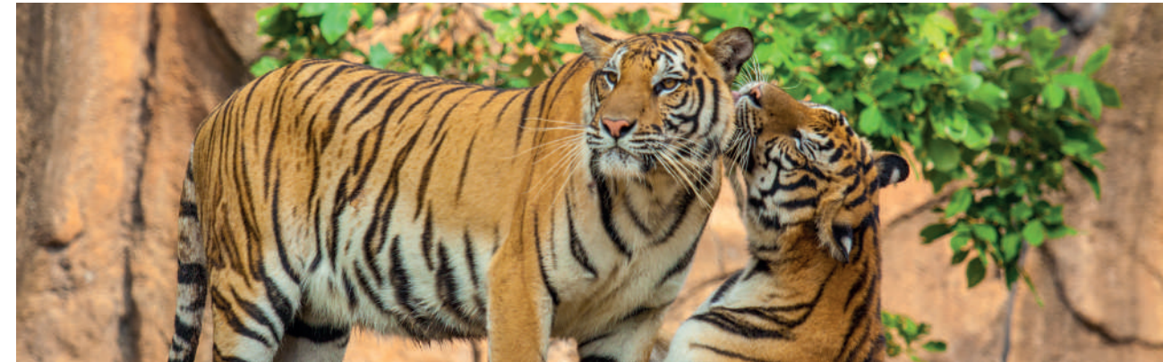
Parco Nazionale di Ranthambore, India