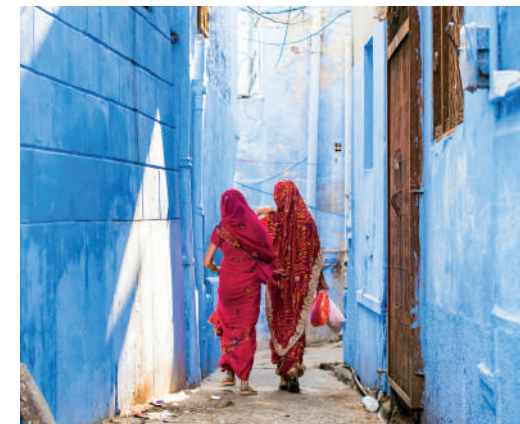
Città Blu e Forte Mehrangarh, Jodhpur, India

Volo per Udaipur, la "Città Bianca" lungo le sponde del lago Pichola. Escursione in barca al tramonto e tempo per un aperitivo, ammirando Udaipur con le luci della sera.