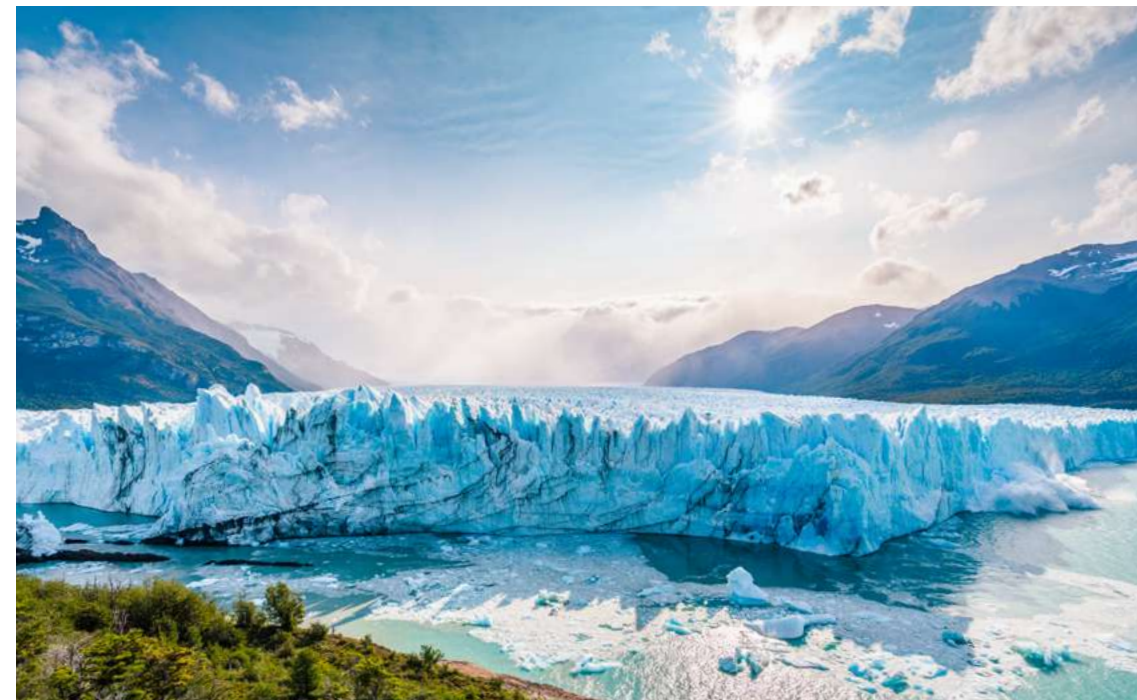
Perito Moreno, parco nazionale los Glaciares, Santa Cruz, Argentina