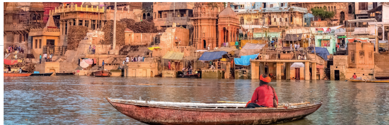
Fiume Gange, Varanasi, India

Partenze garantite minimo 2 massimo 14 partecipanti