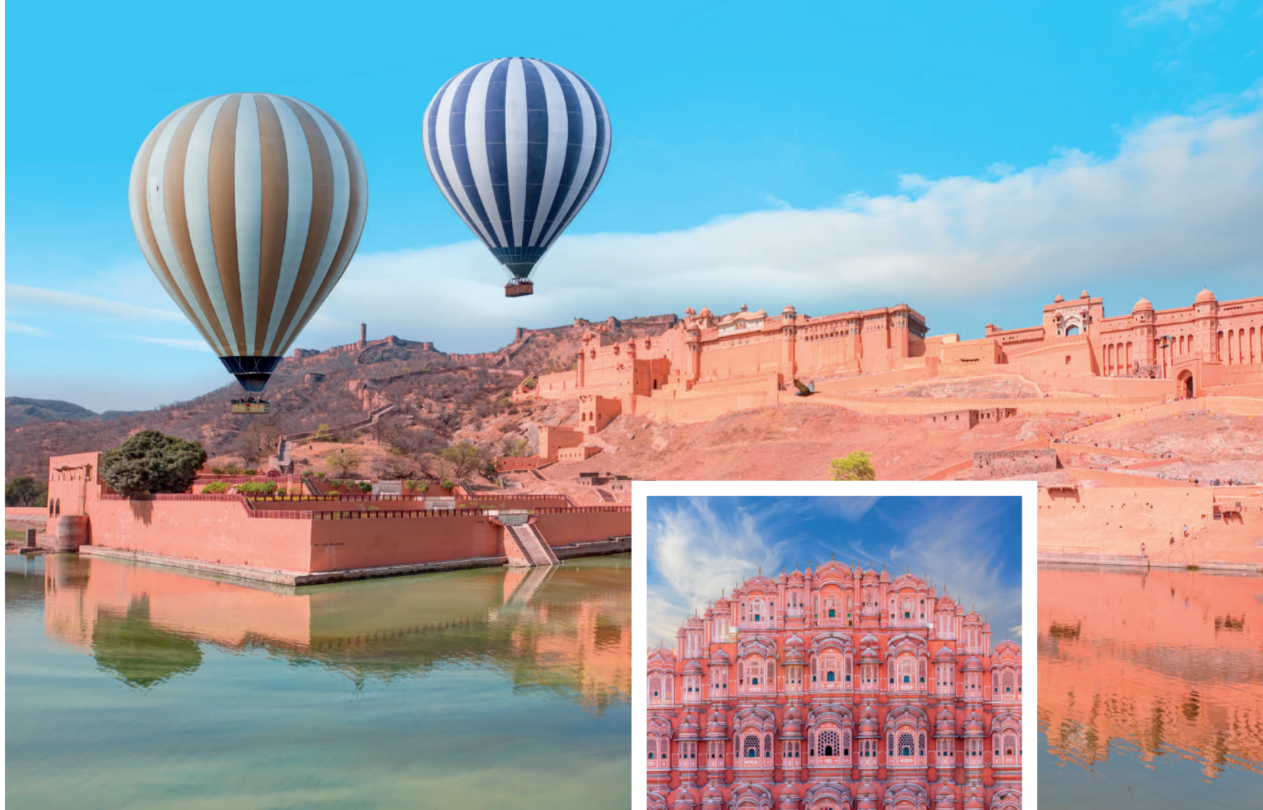
Amber Fort, Jaipur, Rajasthan, India