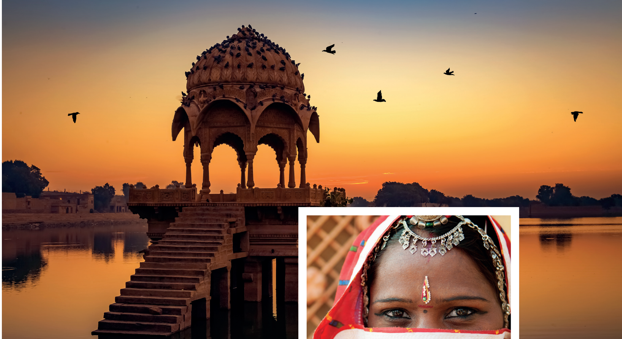
Gadi Sagar, Jaipur, Rajasthan, India

Trasferimento in aeroporto per il volo di rientro in Italia.