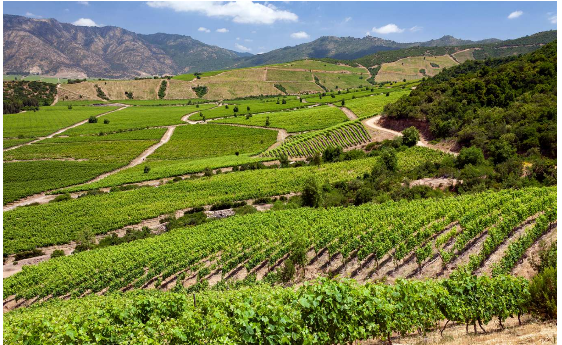
Valle di Colchagua, Cile