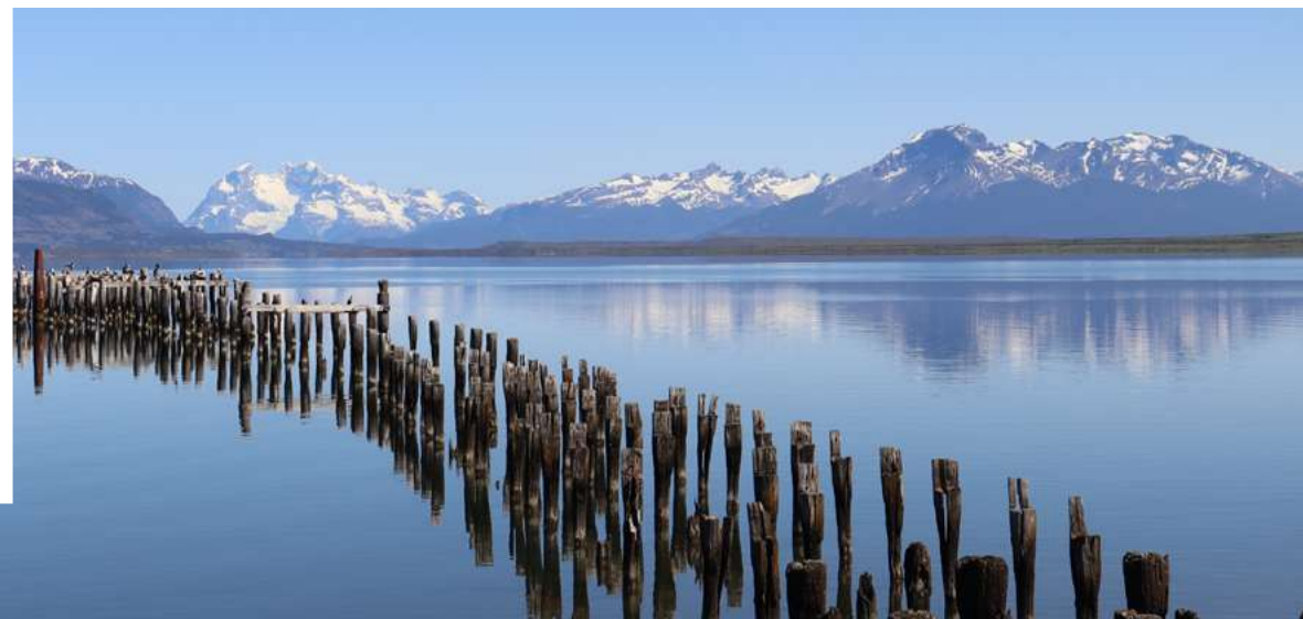
Puerto Natales, Cile

Visita guidata del Parco Nazionale Torres del Paine per scoprire le