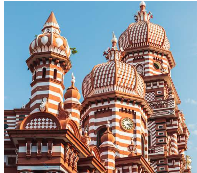
Colombo, Sri Lanka