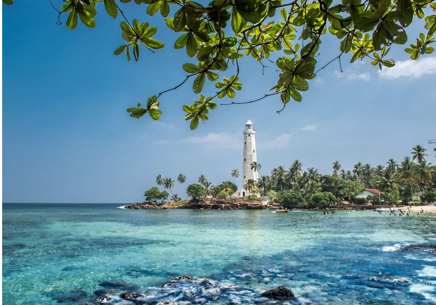
Matara, Sri Lanka

Trasferimento in aeroporto per il volo di rientro.