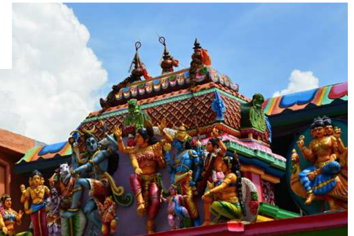
Tempio hindu a Matala, Sri Lanka

Partenze garantite minimo 2 massimo 14 partecipanti